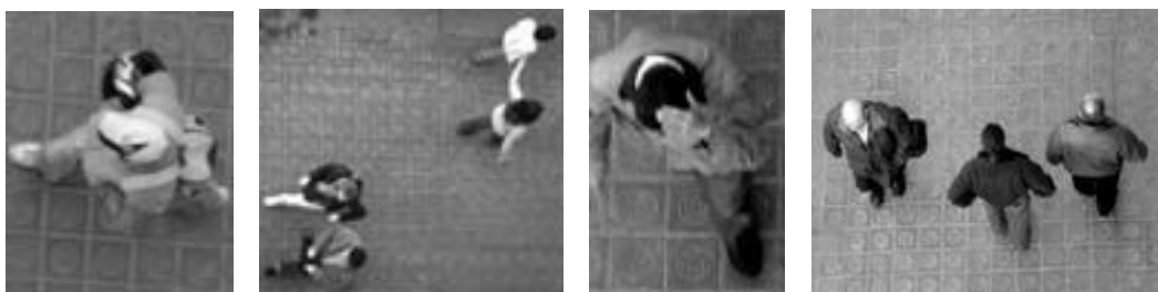
FIGURA 1. Primeiros ensaios.

Nossa primeira experimentação circunscrevia ao básico desse projeto tirando fotografias dos transeuntes (sozinhos ou em pares). Observamos um resultado muito curioso e interessante que foi o “transpasso” entre eles, ou seja, pessoas que caminhavam em sentidos opostos, mas que ficavam lado a lado por uma fração de segundos. O momento seguinte, e mais reflexivo, foi fotografar o ambiente sem as pessoas, que seriam os carros estacionados e motos, as árvores, a rua e suas “marcas”, e a sombra projetada em diagonal do edifício sobre a rua. No nível do terceiro andar, a máquina não permitiu, com seu zoom de pequeno alcance, a aproximação necessária para melhor compor a fotografia com as pessoas melhor enquadradas no campo visual fotográfico. O “recorte” das fotografias foi feito a posteriori .