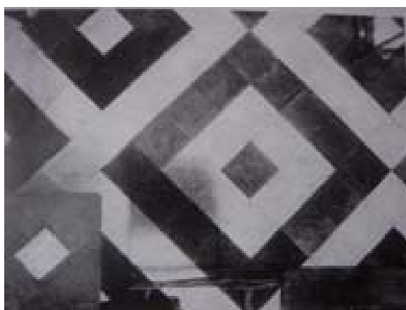
FIGURA 2. Ponto de vista incomum de uma pintura (piso de uma casa) para compor um aparelho de diversão ótica do pintor renascentista Hoogstraten.

Uma exceção foi o artista holandês Hoogstraten, que pintou o piso de uma casa, ainda assim somente pra compor sua caixa de perspectiva.